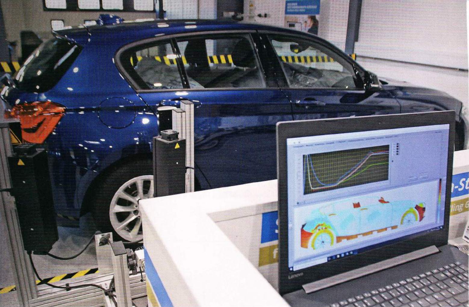
Hat das Auto etwas zu verbergen? Dem Computerauge entgeht nichts.